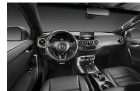
高品質コックピットモジュール

世界を代表する完成車メーカーに認められた高品質なコックピットモジュール製品を展示しています。緻密にレイアウトされたモジュールは高度な設計力の証です。